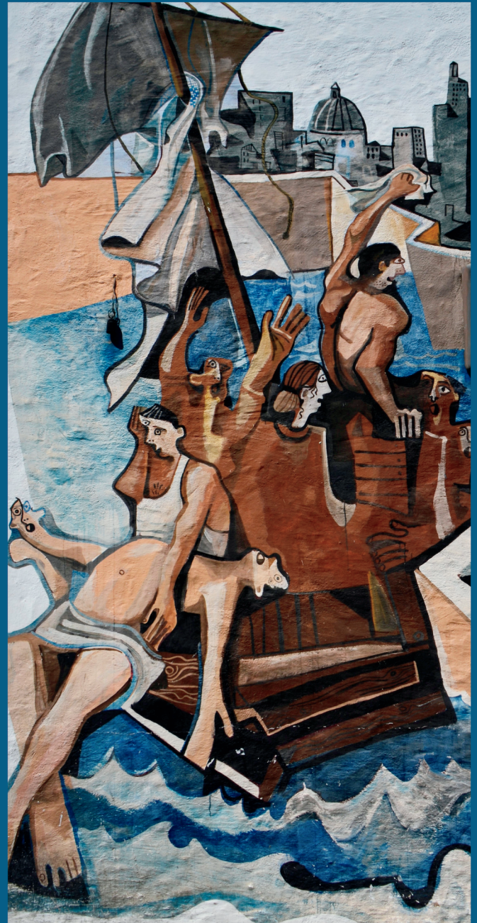
Murales "Siamo tutti clandestini", Orgosolo